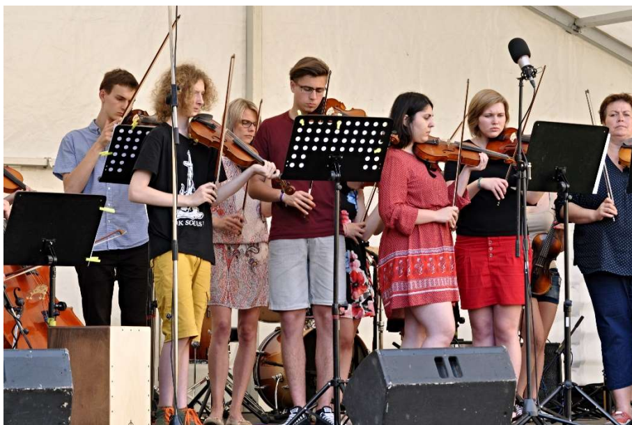
ZUŠ OPEN, květen 2017