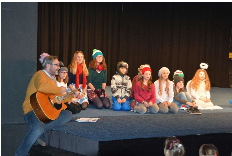
Vánoční vystoupení LDO a TO, prosinec 2016