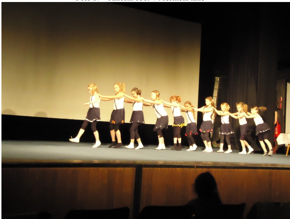
Foto 18 - Taneční obor v Městském kině