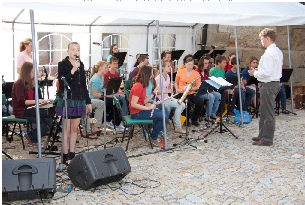
Foto 13 - Letní koncert na Sezimově náměstí