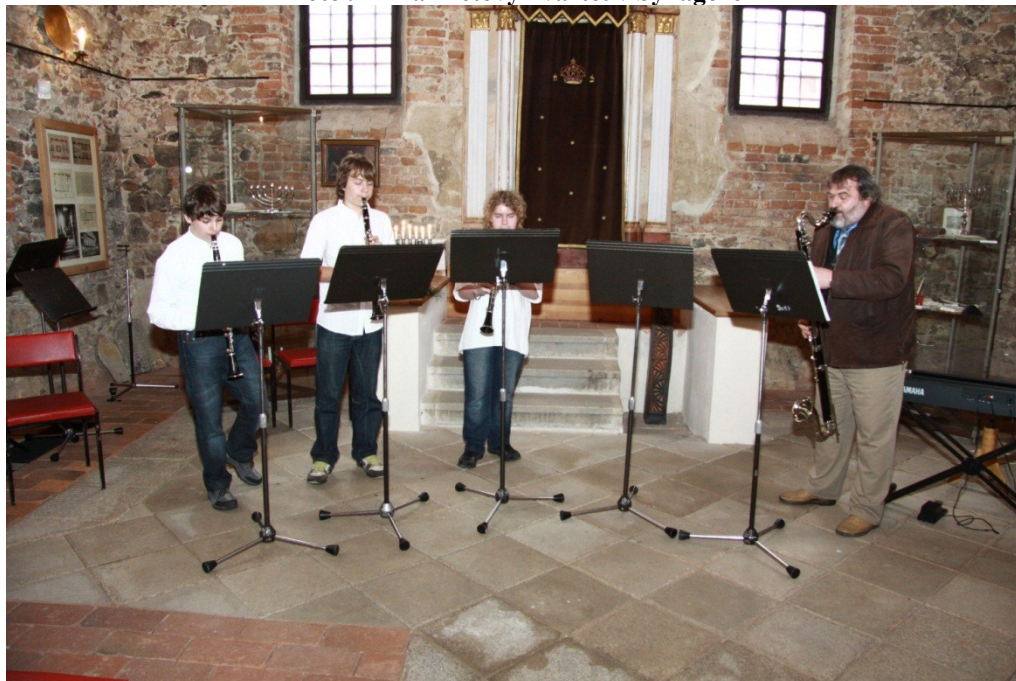
Foto 10 - Soubor zobcových fléten v Synagoze