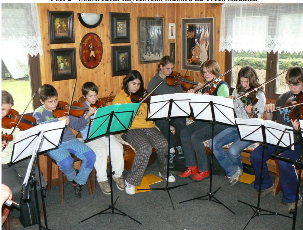
Foto 3 - Soustředění smyčcového souboru na Třech studních

2. května 2011 upořádala ZUŠ Polná pro své žáky zájezd do Brna na koncert filharmonie. Koncert měl lákavý název: Filharmonie Brno hraje rock a pop. Ze strany žáků i pedagogů byl o tento koncert velký zájem. Celá akce se vydařila.