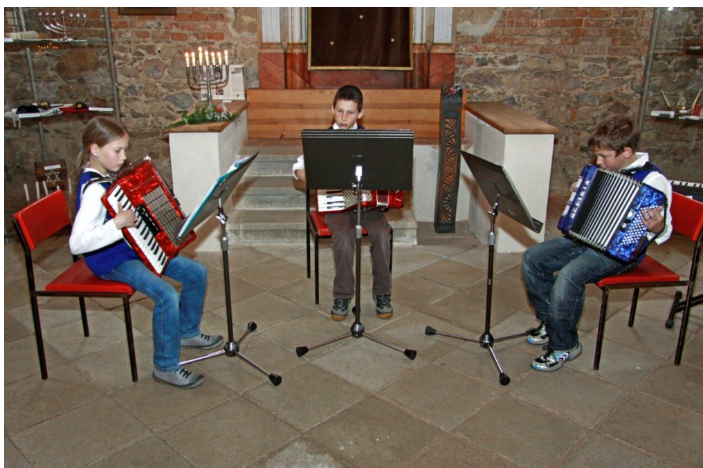
Foto 4 - Akordeonové trio v Synagoze

Výsledek kontroly Dohoda nebyla porušena v žádném z jejich bodů.