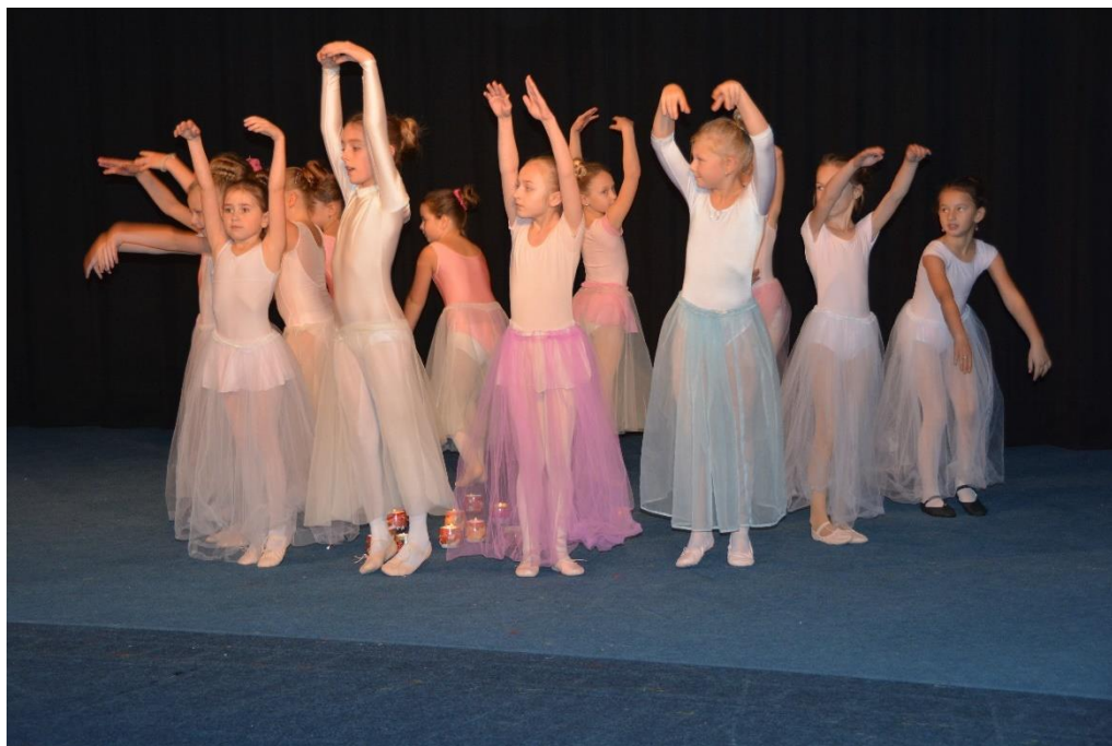
Dopoledne pro předškoláky, duben 2019